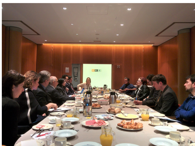
Przedstawiciele CCBE i posłowie do Parlamentu Europejskiego Jan Philipp Albrecht, Birgit Sippel i Juan Fernando López Aguilar podczas okrągłego stołu poświęconego nadzorowi