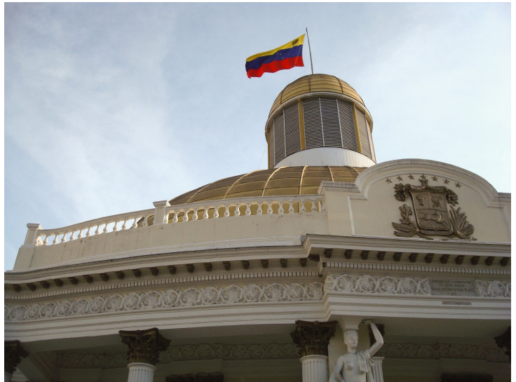
Palacio Federal Legislativo, Caracas.

Od czerwca 2016 r. do maja 2017 r. Europejska Fundacja Prawników realizowała projekt mający na celu pomoc w przywróceniu praworządności w Wenezueli; głównym osiągnięciem projektu jest opracowanie szczegółowego planu koniecznych do podjęcia działań. Ze względu na sukces pierwszego projektu, Europejska Fundacja Prawników kontynuuje prace w tym kraju, obecnie koncentrując się na niezależności wymiaru sprawiedliwości, który jest postrzegany jako kluczowy element przywrócenia praworządności. W tej chwili Fundacja pracuje nad sprawozdaniem, w którym zawarta zostanie analiza etapów, przez które musi przejść Wenezuela aby wprowadzić niezależny wymiar sprawiedliwości. Fundację wspierają prawnicy z różnych krajów, którzy wnoszą swoją wiedzę do projektu. Fundacja współpracuje także z prawnikami wenezuelskimi i lokalnymi organizacjami pozarządowymi zajmującymi się kwestiami dot. sprawiedliwości. Nowy projekt rozpoczął się w październiku 2017 r. i potrwa do września 2018 r. Zagadnienia przewidziane do analizy obejmują sposób wprowadzenia nowej ścieżki kariery w sądownictwie, która bazowałaby na wybitnych osiągnięciach i jakości oraz kwestię czy ustanowienie Rady Sądowniczej mogłoby pomóc w zapewnieniu istnienia niezależnej władzy sądowniczej.