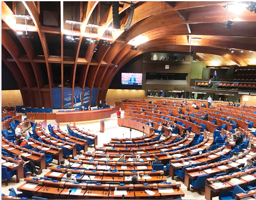
Zgromadzenie Parlamentarne Rady Europy