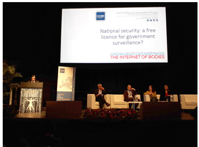
Iain Mitchell QC otwiera panel CCBE podczas konferencji.