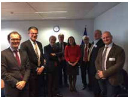
Spotkanie CCBE i Komisji w sprawie powołania EPPO

25 kwietnia CCBE odbyło spotkanie z wysokim szczebla reprezentantami Komisji Europejskiej. Miało ono na celu dyskusję nad niektórymi aspektami projektu powołania Urzędu Prokuratury Europejskiej (EPPO). CCBE podkreśliło potrzebę wprowadzenia odpowiednich gwarancji proceduralnych, a w szczególności efektywnego systemu pomocy prawnej jako koniecznego elementu tych gwarancji, a także