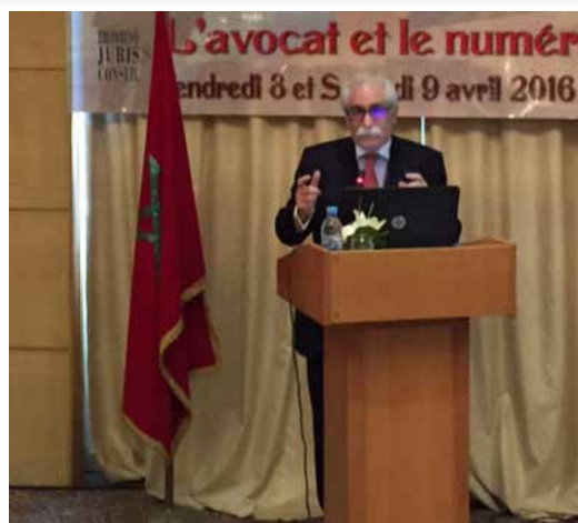
Prezydent Michel Benichou przemawia w Casablance

Szersze informacje są dostępne pod linkiem .